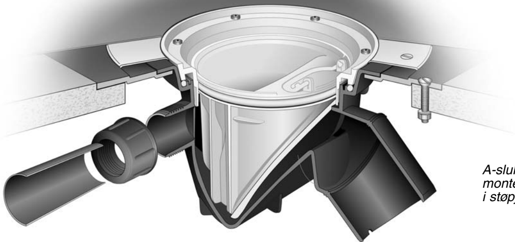
A-sluk montert med monteringsplate i støpejern.

Monteringsplaten er produsert i støpejern og kan gjenvinnes.